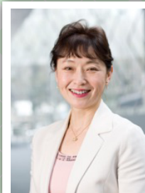
つかむらひろこ 東村博子氏

名古屋大学大学院生命農学研究科教授、農学博士・名古屋大学副理事(男女共同参画担当)・男女共同参画室長。名古屋大学において教育・研究を通じて人材育成に努める傍ら、男女共同参画担当総長補佐(2006~2015年)および名古屋大学副理事(2015年~現在)として女性教員比率の増加、育児と仕事の両立支援、女子学生支援策の推進などに努め、大学、研究機関、自治体、企業等での男女共同参画推進のための講演など多数。文部科学省リーディング大学院プログラム「ウェルビーイング in アジア」実現のための女性リーダー育成プログラムプログラムコーディネータとしてグローバルに活躍できる女性リーダーの育成にも貢献。専門は生殖科学・神経内分泌学。現在のテーマ:哺乳類の生殖を制御する脳内メカニズム、脳の性分化メカニズム。国内外の学会にてシンポジウム・教育講演など招待講演多数。家畜繁殖学会島村賞(1995年)、下垂体研究会吉村賞(2003年)受賞。