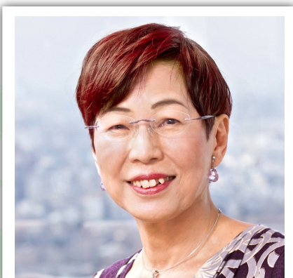
うえのちづこ 上野千鶴子氏

社会学者・東京大学名誉教授・認定NPO法人ウィメンズアクションネットワーク(WAN)理事長( http://wan.or.jp/ )。1994年『近代家族の成立と終焉』(岩波書店)で「サントリー学芸賞」受賞。2011年度、「朝日賞」受賞。受賞理由「女性学・フェミニズムとケア問題の研究と実践」。専門は女性学、ジェンダー研究。この分野のバイオニアであり、指導的な理論家のひとり。高齢者の介護問題にも関わっている。最新刊『時局発言!』(WAVE出版)